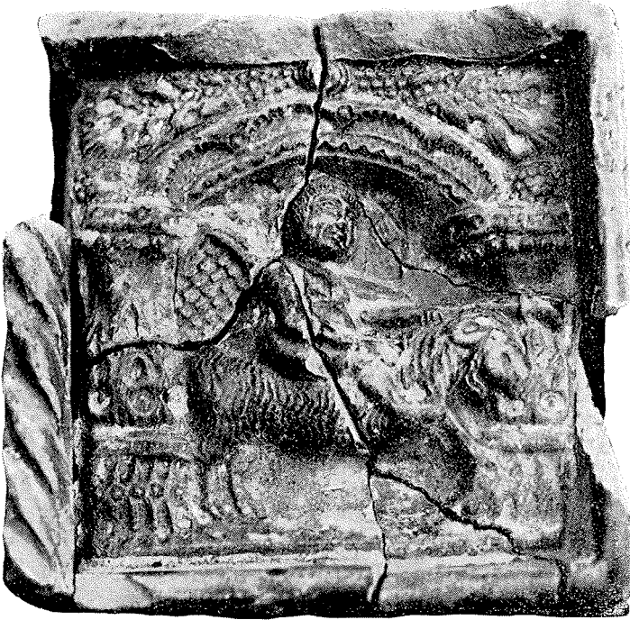
Fig. 3. Lyngfundet.

En omtrent hel Kakkelfund (der findes flere Brudstykker af samme Slags) er forsynet med et dybt