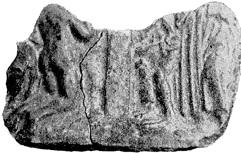
Fig. 4. Flad Kakkal, lysegrøn Glasur og med en knælende, nøgen Figur.

I Næstved har man en lignende Kakkal, men uden