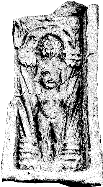
Fig. 2. Lyngefundet.

noget for Øjet ogsaa. Derfor fandt Pottemagerne paa at fremstille — med Henblik paa de gennem ældre Middelalder anvendte ornamenterede og glasserede Gulv- og Vægfliser af Ler — Lerkakler med eller uden Glasur og med eller uden Billeder eller Mønstre.