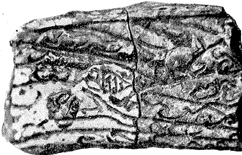
Fig. 5. Flad Kakkel, „begittet“ og med Ornament.

For det første taler de mange forskellige Kakler, der er henkastede paa samme Sted. De fundne Kakler maa vel nemlig have tilhørt flere forskellige Kakkellovne. Og hvilket Hus i Lyng har været saa fint udstyret i Tiden ca. 1600?