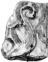
Fig. 6. Formentlig Rest af en gotisk Kakkal.

Det er bemærkelsesværdigt, at der spredt over en stor Del af Marken fandtes andre sammenbrændte Slagger af meget stor Vægtfylde. Kan det være Rester fra Jærnvinding ?