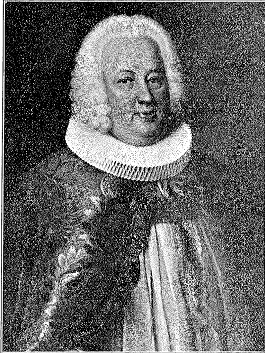
Biskop Peder Hersleb.

Man mærker jo nok, at denne Vejledning til Skolehold ikke er fra det tyvende Aarhundrede. Men det er i Virkeligheden et højt Undervisningsideal, der ud-