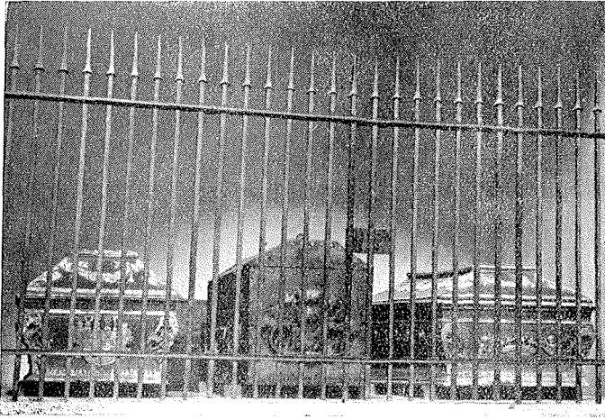
Det sydligste Østkapel i Sorø Kirke, skraat over for Ramel-Sehesteds Kapel.