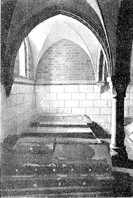
Ramel-Sehesteds Kapel med Sehestedernes Kister.