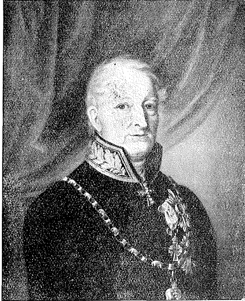
Ove Ramel Sehested 1757-1838. Statsminister.