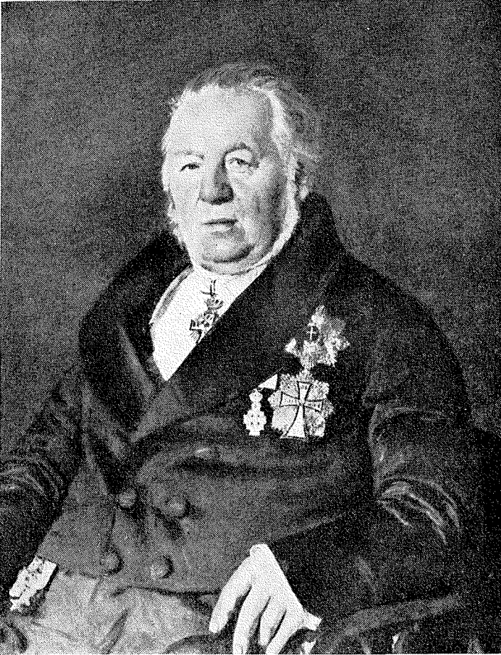
Statsminister P. C. Stemann.