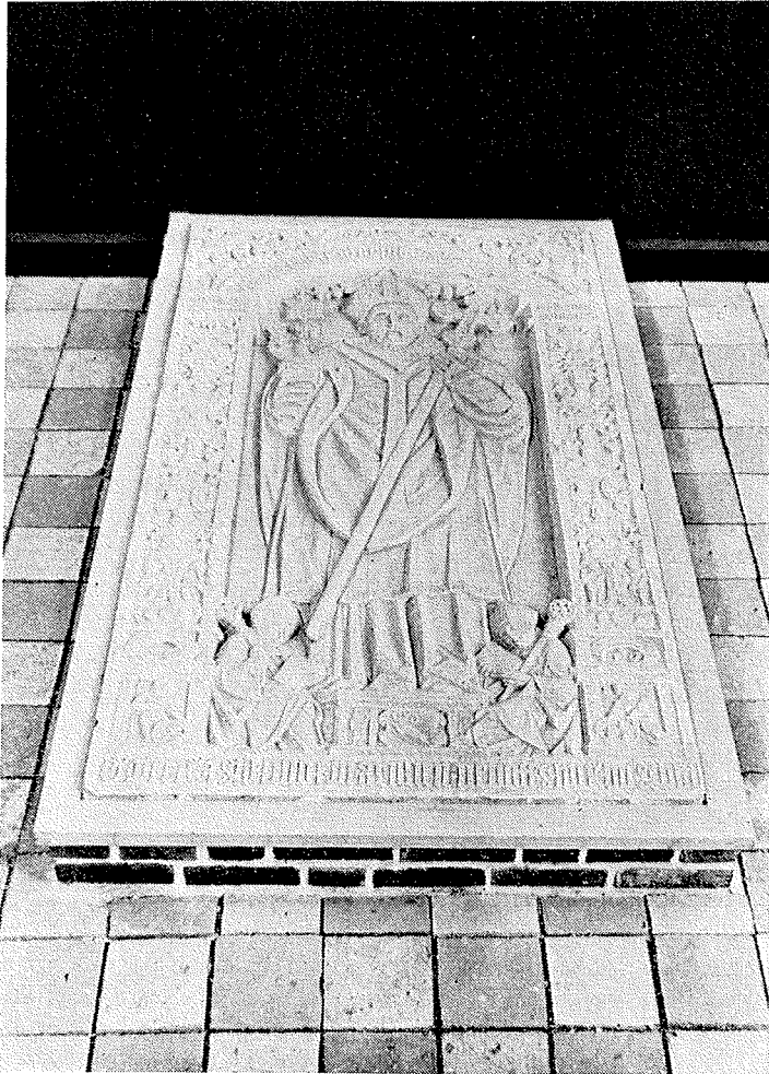
Absalons Grav efter Restaureringen.