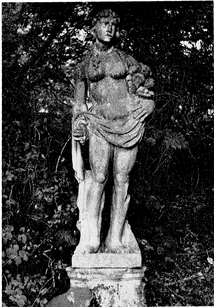
Grevinden med ni-lingerne.