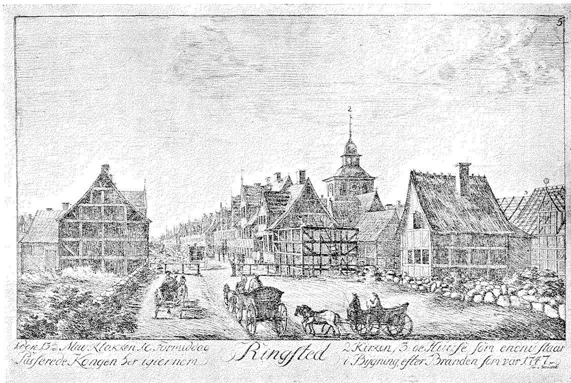
Indkørsel til Byen fra Nord, „Nørre Port“. Nørregade under Genopbygningen efter den store Brand 1747. Kong Frederik den 5. gæster Byen den 13. Maj 1749.

(Det kgl. Bibliotek - efter Tegning af P. J. Grønvold)