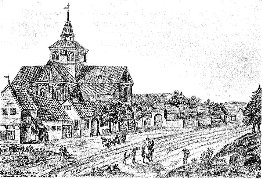
Indkørsel til Ringsted fra Vest. „Vestre Port“, med Sct. Bendtsgade og Kirken i 1700-Aarene. Bag Træerne ses den gamle Post- og Gæstgivergaard. I Baggrunden ses Bommen og det lille Bombus.

Studenten i sin Beretning, men omtaler, at det var en Dreng, der ved sin Uforsigtighed var Skyld i den frygtelige Brand. Men trods dette hviler der en vis Mystik over denne Begivenhed, idet saadanne mundtlige Overleveringer ofte bæ-