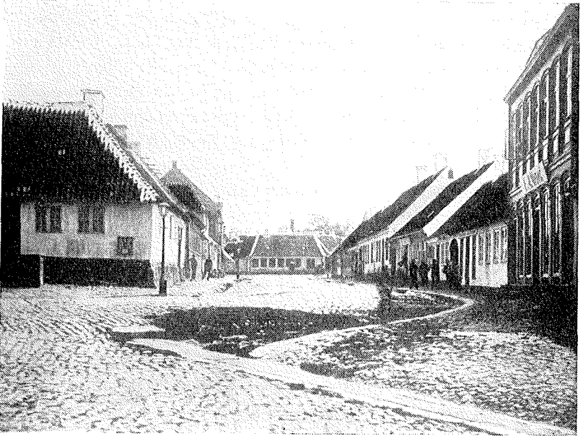
Sct. Hansgade set mod „Lille Torv“. Man ser her Gadens Kloakrende mod Sogade. (Billede fra ca. 1870). Bebyggelsen i Gadens højre Side, set fra Torvet, stammer fra Opbyggelsen efter Branden i 1806, hvorimod Bygningerne i den modsatte Side af Sct. Hansgade stammer fra Opbyggelsen efter Branden 1747.

ingen vil kunne fortsætte sin forrige Næringsvej og opbygge sin afbrændte Ejendom uden ved Hjælp af godgørende Menneskers Understøttelse. Nøden og Trangen er meget stor, men