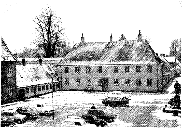
Torvet i Sorø 1965. Søndre side.

århundrede. Men det er nu ikke desmindre fuldt forsvarligt. Hvor overbevist „abstrakt“ Johan Rohde allerede dengang var, kan dokumenteres af et brev, han skrev til sin ven Emil Hannover fra en anden stille og afsides dansk provinsby, nemlig Ribe. I dette brev — der er dateret den 15. juli 1890 — skriver han bl. a.: „Iøvrigt er jeg rejst herover for at finde nogle flade Landskaber med høj Luft over — Marskenge f. Ex., ikke giftig grønne med en kjedsommelig blaa Himmel (intet virker saa frastødende paa mine Øjne — i det mindste for Øjeblikket — som blaat og grønt), men douce taaget-violet-graalig-gulligt Engdrag med en fugtig, fed Graa-vejrhimmel eller ubestemmelig Varmedis. Jeg valgte Ribe, skjønt det har sine store Skyggesider at være „Landskabsmaler“ i en Kjøbstad, man har ikke sine Apparater saaledes