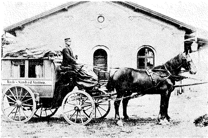
Dagvognen mellem Rude og Sandved station