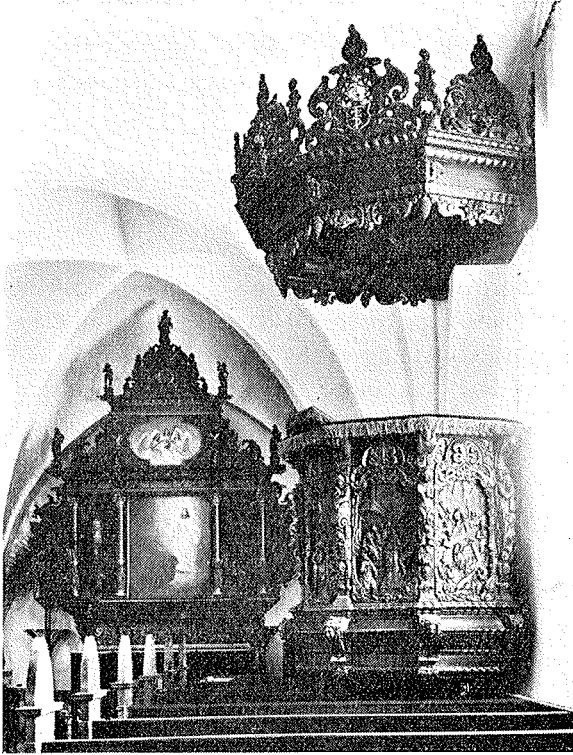
Altartavle og prædikestol i Nordrup kirke