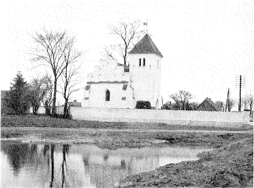
Lind Studio, Vinna