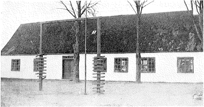
Ørslev gl. skole

ning. Han var forøvrigt den første seminarieuddannede lærer ved skole og havde beklædt embedet siden 1844. Han var gift 2. gang og med en gårdmandsdatter fra sognet. Han var lidt af en selskabsmand og groet fast i sognet. Hans helbred var ikke det bedste. Han døde i 1888 og overlevedes i mange år af sin hustru.