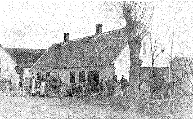
Den gamle smedie i Høm

Forsamlingshus havde vi ikke i min ungdom, men vi dansede heller ikke så meget. Der lå en lille gård på Rødstensgårdens mark, Det