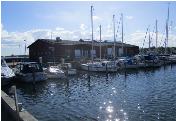
Det Røde Pakhus. Foto: Ole Skude, 2019.

Efter byvandringen er der generalforsamling og kaffebord.