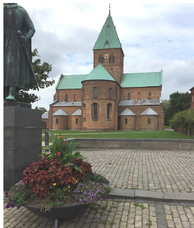
Sct. Bendts Kirke.