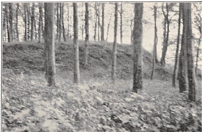
Margrethevolden (Borrenakke), set fra Syd.

Men Margrethevolden maa sikkert kunne beteg-