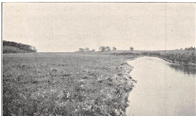
Borre Aa, til venstre Skoven („Margrethevolden“ er lige indenfor Skovbrynet.)

Sagnet om hendes Forhold til denne Høj har endog i stedlig Overlevering bevaret den faste Form: