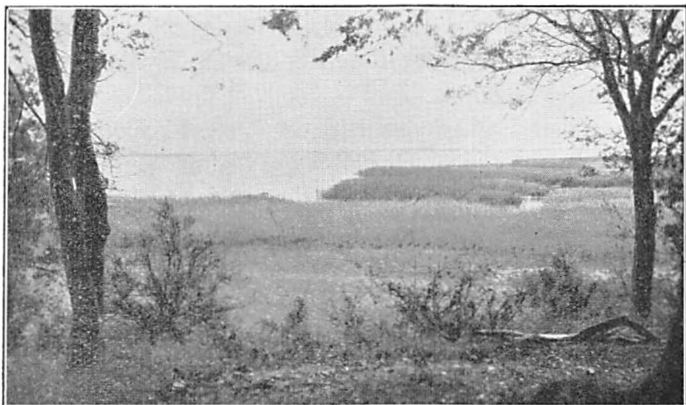
Udsyn fra „Margrethevolden“.

Inde i Saltø Skov (V. f. Landevejen, ca. \frac{1}{2} Km. fra denne) fører en Skovvej ned mod en Spang og et ældre Vad omtrent midtvejs mellem Margrethevolden og Saltø. Saltø Aa eller Borge Aa, som den lejlighedsvis kaldes, har i en Tid, hvor Vandløbene var uregulerede og langsomt vandførende, hvad der har gjort det omgivende Terræn langt vandrigere og derfor mere ufremkommeligt end i Nutiden, saaledes