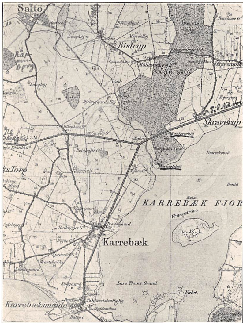
Kort over Egnen ved Borrenakke Skov.