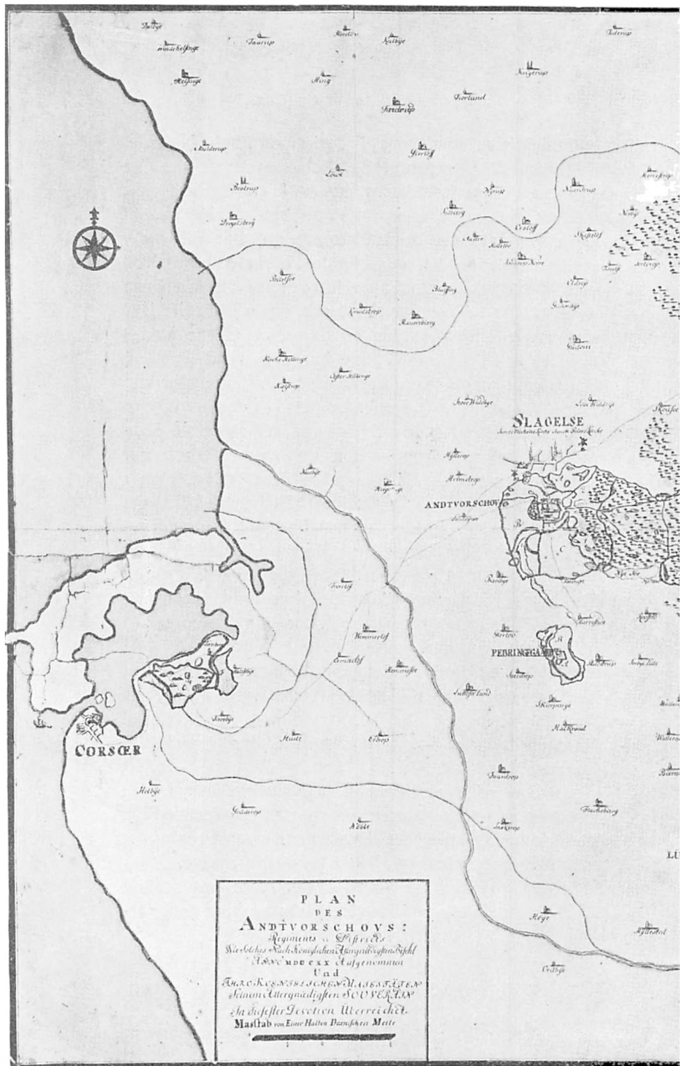
PLAN DES ANDTVORSCHOVS : Régiments de Cavalerie Wie solches nach dem Befehl des Königs Anno 1705 gemacht worden Und Von dem Königl. Ingenieur Simon Utterquaden SOUV. LIEUT. In dieser letzten Verändert. Masstab von Einer halben Dantzischen Meile