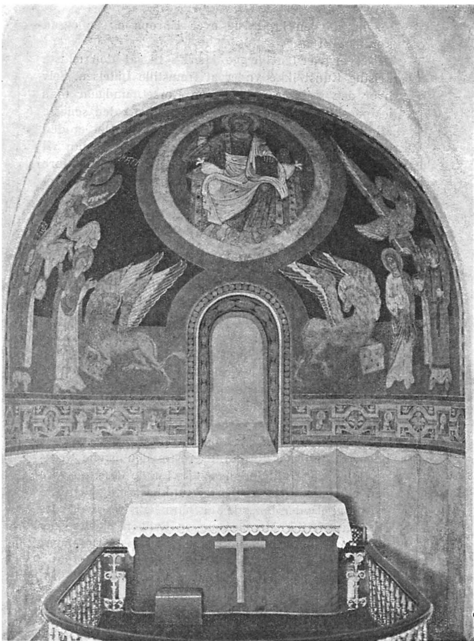
Kalkmaleri i Apsis. Alsted Kirke. Omtrent som i Broby, men bedre bevaret.