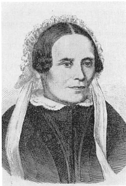
Træsnit fra 1870.