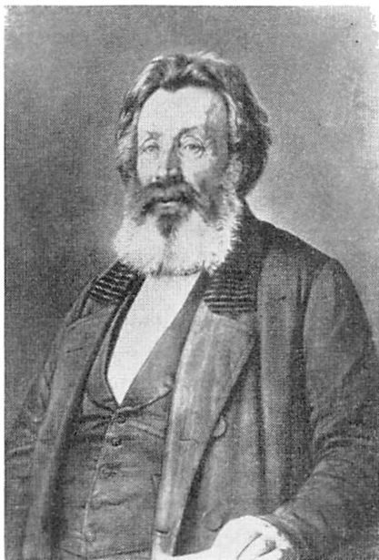
Maleri af J. Roed 1866.

og altid med et livets frø i sig. Men han havde ikke den formende evne, der kunne gøre dem rigtig forstaaelige for andre eller rigtig skikkede for virkeligheden. Og den havde hun just. Det var saa karakteristisk, er derfor ogsaa saa tidt fortalt, at naar Stephansen rigtig havde kørt rundt med sine billeder