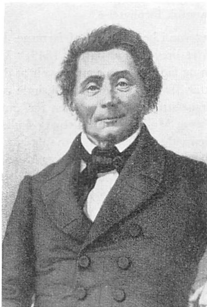
Litografi 1859 efter Daguerreotypi 1856.