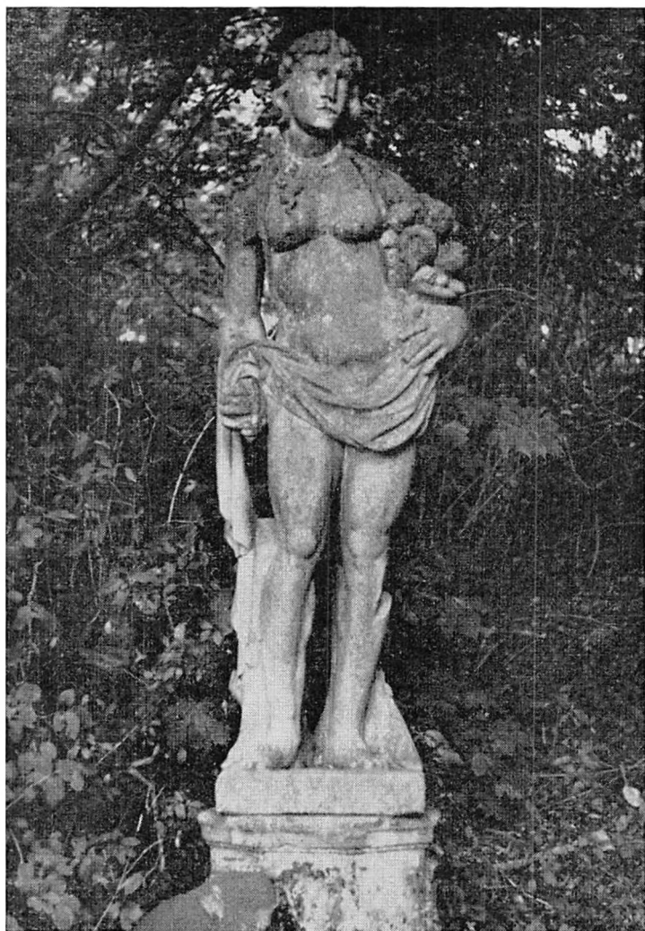
Grevinden med ni-lingerne.