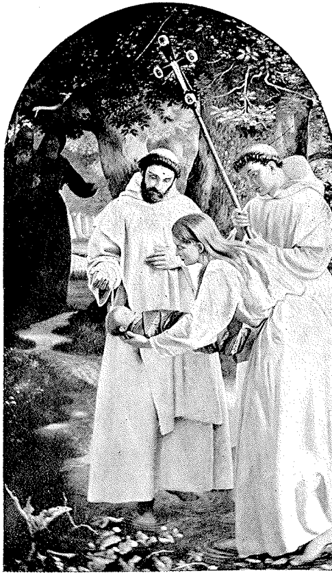
Ansgar og Ødbert døber en ung Moder og hendes Barn.