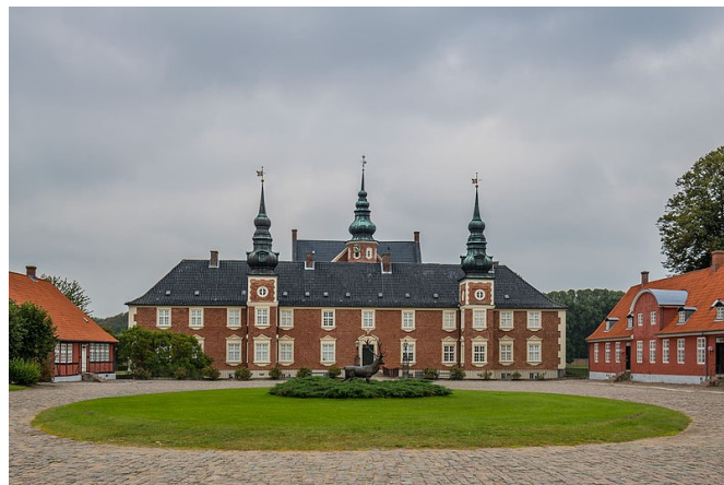
Jægerspris Slot.

Kong Frederik VII blev den sidste kongelige ejer af slottet. Ved enevældens ophør i 1848 overgik slottet til staten. 1854 tilbagekøbte kongen imidlertid slottet til brug som tilflugtssted fra det højere borgerskab og aristokratis forargelse over hans borgerlige ægteskab med Louise Christine Rasmussen (bedre kendt som Grevinde Danner).