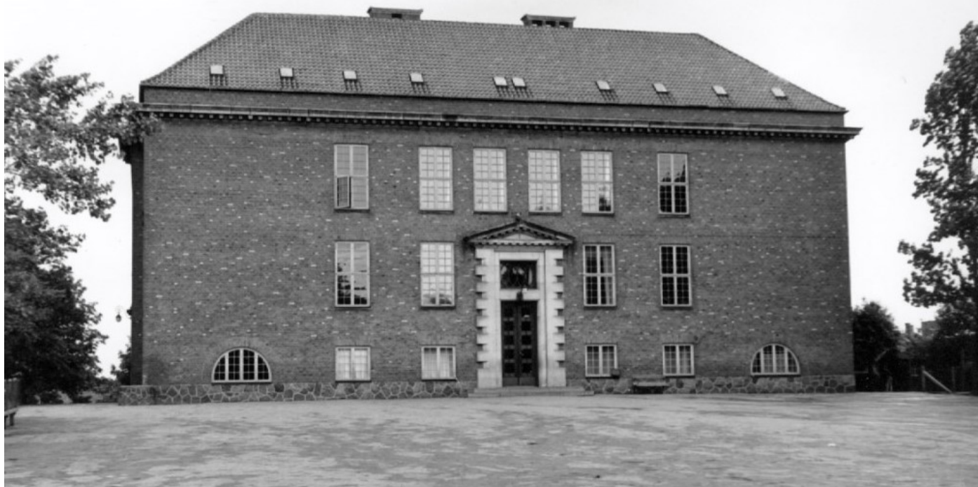
Halsskovskolen. Foto: Helge Hansen, 1954, Lokalhistorisk Arkiv for Korsør og Omegn.

Du kan også betale til MobilePay 6159 2860 ( husk her at anføre navn ).