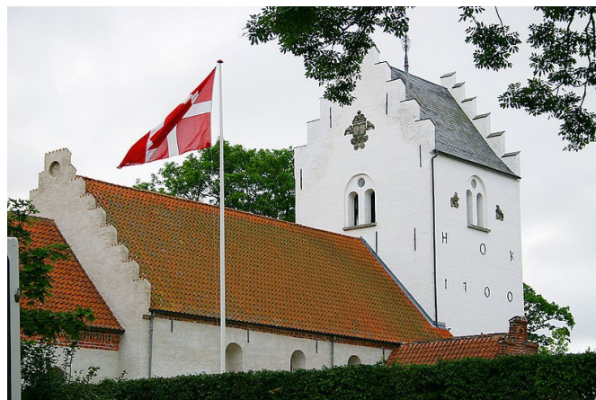
Skibby Kirke. Foto: Malene Thyssen, 2005. Wikimedia.

Kirken har et af Danmarks ældste kalkmalerier fra 1150. Kalkmaleriet blev fundet i 1889, da væggen, som adskilte sakristi og kor, blev revet ned. I det hele taget er kirken rig på kalkmalerier.