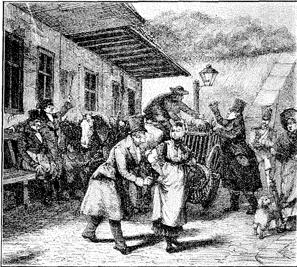
Udenfor en Accisebod.