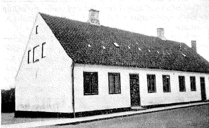
Ejendommen Bjergbygade 12 fotograferet sommeren 1962.