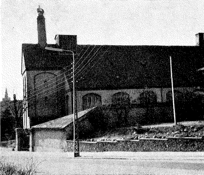
Den østlige fløj af Slagelse bryghus

Siden brygger, kaptajn J. C. Jacobsen i 1847 havde anlagt Carlsberg udelukkende for brygning af bayersk øl, drømte enhver brygger i landet om snarest at optage denne øltype på produktionsprogrammet.